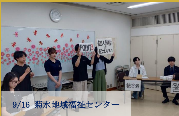
9/16 菊水地域福祉センター