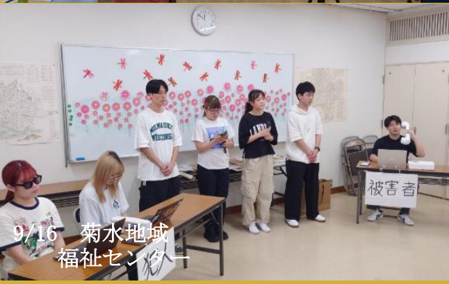
9/16 菊水地域 福祉センター