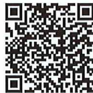
QRコードを読み取り