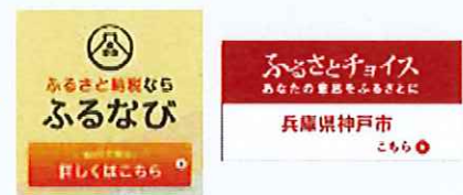
バナーをクリック